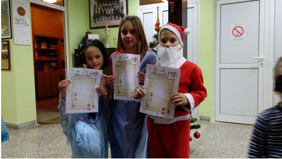
27.1.2016. У матичној школи и ИО Дрежњик обележена школска слава Свети Сава пригодним свечаностима.